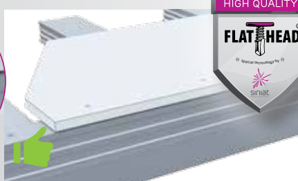
Rozwiązanie oparte na wkrętach typu FLAT HEAD®