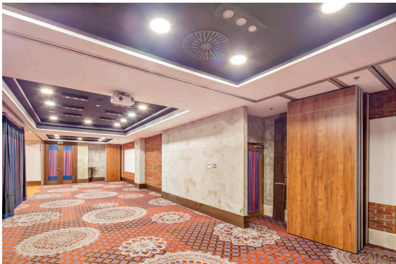
Obiekt referencyjny Siniat – Hotel Bristol Rzeszów

SINIAT Sp. z o.o., ul. Przecławka 8, 03-879 Warszawa, Info Nida: 801 11 44 77, www.siniat.pl