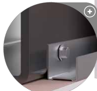
Profile Nida MFCE26